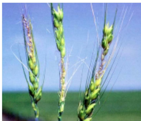
شکل 3- خسارت سرمازدگی در نواحی مختلف خوشه گندم (ممکن است همه گلچه‌ها همزمان دچار سرمازدگی نشوند)