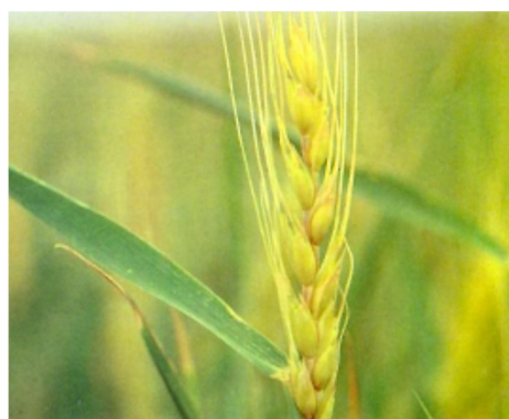
شکل 2- خوشه سرمازده در گندم (یخبندان موجب رنگ زرد و ظاهر نمناک پوسته دانه‌ها در خوشه شده است)