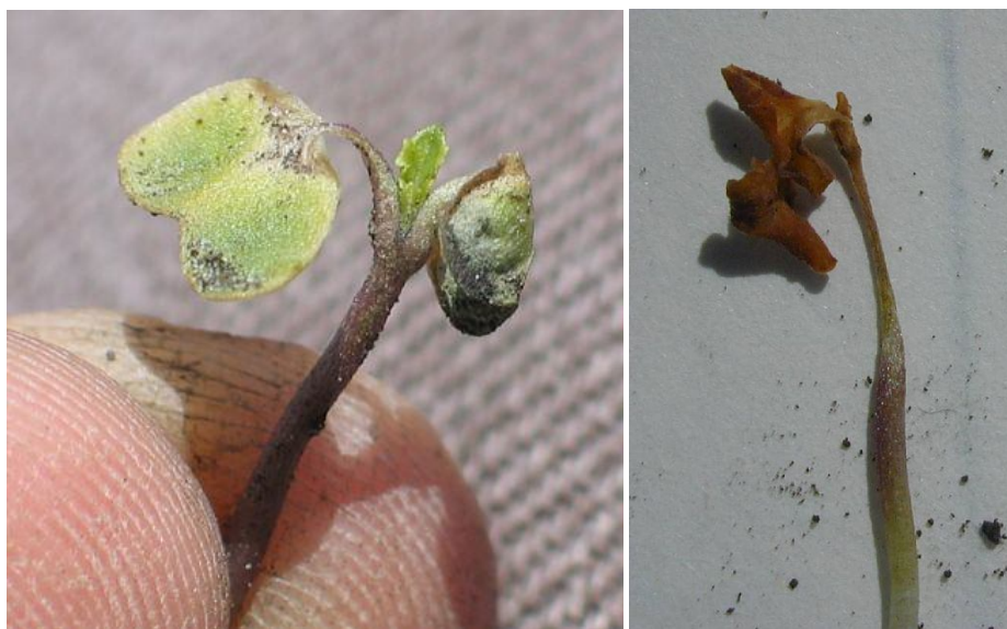
شکل 5- عکس سمت راست کلزای خسارت دیده در سرما و از بین رفته و عکس چپ کوتیلیدون ها خسارت دیده اما ساقه و نقطه رشد آتی سالم می باشند و این گیاه زنده خواهد ماند

سرما های قبل از سبز شدن گیاه تقریباً کشنده هستند و برای منظور برای سرعت دهی به جوانه زنی و خروج از خاک میبایست از روش بذر مال برای سریع سبز شدن استفاده کرد. معمولاً پس از بروز سرما بدلیل آسیب زیاد گیاهچه کار