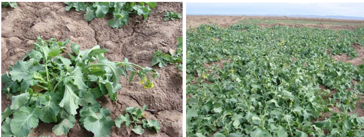
شکل 4- آثار خسارت سرما بر روی کلزا یک روز بعد از سرمای 93/12/4 با حداقل دمای منفی یک درجه سانتی گراد در منطقه نیشابور