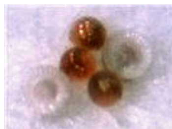
شکل ۲- تخم (تصویر سمت راست) حشره کامل (تصویر سمت چپ)