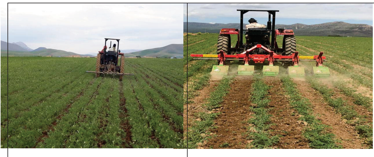
شکل ۱) کنترل مکانیکی علف‌های هرز مزرعه نخود با استفاده از کولتیواتور با ایجاد فاصله بین ردیف ۷۰ سانتیمتر (سمت راست) و ۵۰ سانتیمتر (سمت چپ)

۳-۲-۲- کنترل شیمیایی: با استفاده از علفکش انتخابی سوپر گالانت (۱ لیتر در هکتار) یا گالانت (۲ لیتر در هکتار) می‌توان علف‌های هرز نازک برگ مزارع نخود را کنترل کرد. برای مبارزه با علف‌های هرز پهن‌برگ یکساله در مزارع نخود، استفاده از علفکش انتخابی لتاگران (به میزان ۳/۵ - ۲/۵ لیتر در هکتار) توصیه می‌گردد. زمان سمپاشی باید در اوایل رشد (مرحله ۳-۴ برگگی) علف‌های هرز باشد.