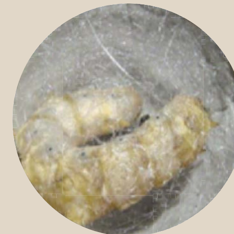
شکل ۱۱- مرحله تئیدن پيله