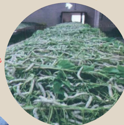
شکل ۸- بستر طبقاتی پرورش کرم بالغ

در این نوع تلبارها، بسترهای پرورش در دو یا سه طبقه و در طول سالن و به عرض ۱/۵ متر ساخته و مورد استفاده قرار می گیرند