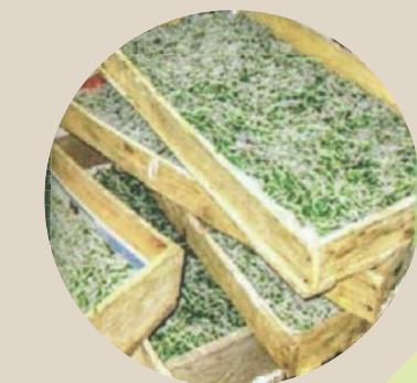
شکل ۶- سینی های چوبی