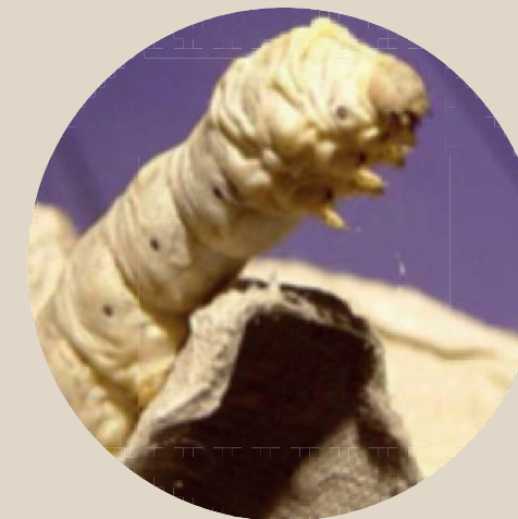
شکل ۱۰- آماده شدن لارو برای پيله تئیدن