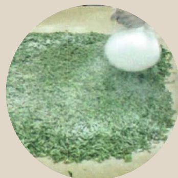
شکل ۵- نحوه پاشیدن پودر