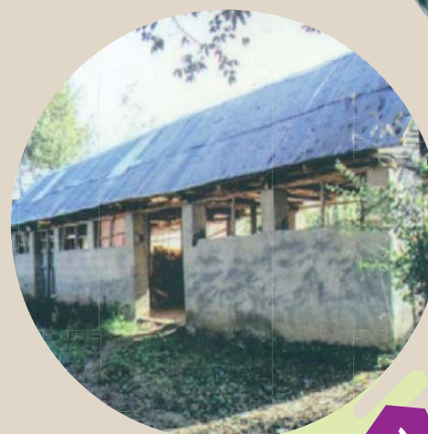
شکل ۹ - تلبار نیمه صنعتی