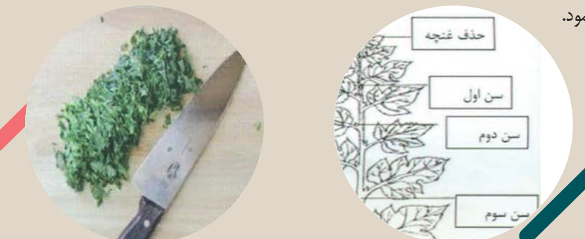
شکل ۴- نحوه خرد کردن برگ توت

برای پرورش کرم جوان می بایستی از برگ های قسمت انتهایی شاخه ( غیر از غنچه ) استفاده نمود و نباید از برگ هایی که به صورت جوانه بوده و هنوز کامل نگردیده استفاده نمود.