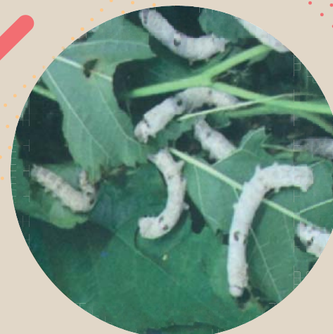
شکل ۷- لارو کرم بالغ

در زمان تئیدن پيله مطلوب است محل پرورش از دمای ۲۵ درجه سانتیگراد و ۷۰ درصد رطوبت برخوردار باشد. حرارت و رطوبت کمتر و زیادتر از حدود فوق موجب کاهش پيله تولیدی و بروز خسارت اقتصادی محصول می گردد. ضروری است در دوره تئیدن پيله تهویه محیط پرورش به خوبی انجام گیرد، همچنین لازم است از جابجایی کرمها و دست زدن به آنها اجتناب کرد. برای تئیدن پيله از وسایل اختصاصی این کار که اصطلاحاً مابشی نامیده می شود. استفاده می گردد. در صورتی که وسایل مذکور در اختیار نباشد می توان از کاه و کلش خرد نشده یا شانه تخم مرغ یا گیاهان محلی خشک شده در آفتاب که دارای انشعاب زیاد بوده و بوی زننده ای نداشته باشند. استفاده نمود.